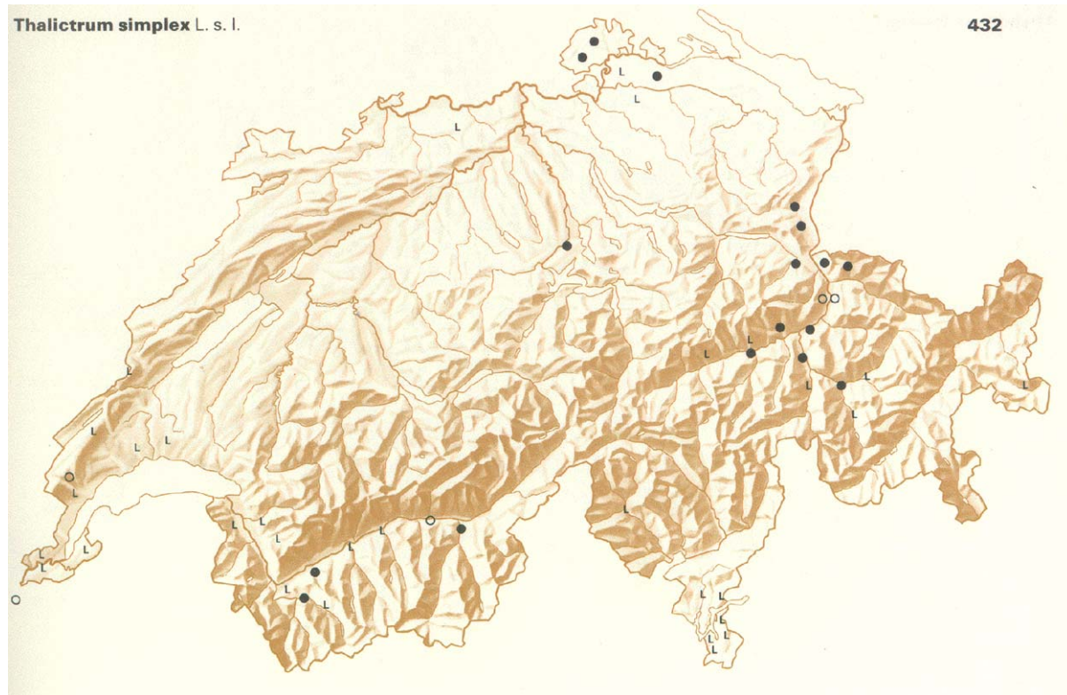
Abbildung 1. Verbreitungssituation von Thalictrum simplex (Einfache Wiesenraute) um 1980 in der Schweiz (aus Welten & Sutter, 1982). Schwarze Kreise / Dreiecke: reichliches oder häufiges Vorkommen, helle Kreise / Dreiecke: spärliches oder seltenes Vorkommen, L: Literaturangaben.

ökologische Ansprüche. Da ihr Status im benachbarten Baden-Württemberg als stark gefährdet eingeschätzt wird, dürfte die Art in der Schweiz ebenfalls stark gefährdet sein. Weiter stufen Moser et al. (2002) Thalictrum simplex sowohl gesamtschweizerisch als auch im östlichen Mittelland als stark gefährdet ein.