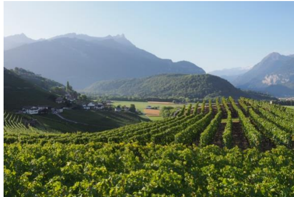
Antagne und die colline du Montet