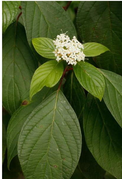
Schirmtraube mit cremeweissen Einzelblüten, Kronblätter klein (2-4 mm)